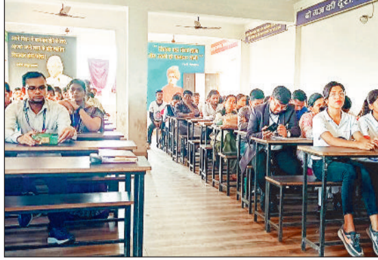
एनएसएस के कार्यक्रम में मौजूद विद्यार्थी और आमंत्रित अतिथि।